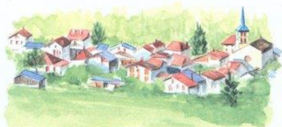
LA CHAPELLE DU BARD