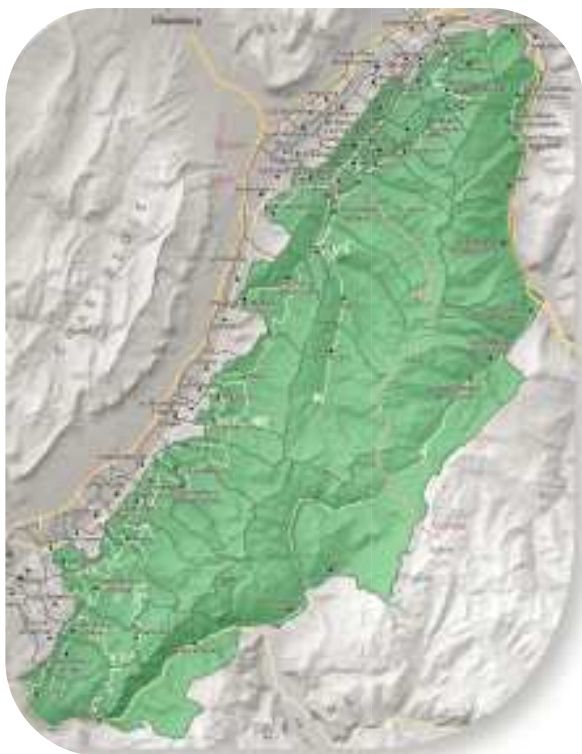
Localisation du projet : Belledonne Nord